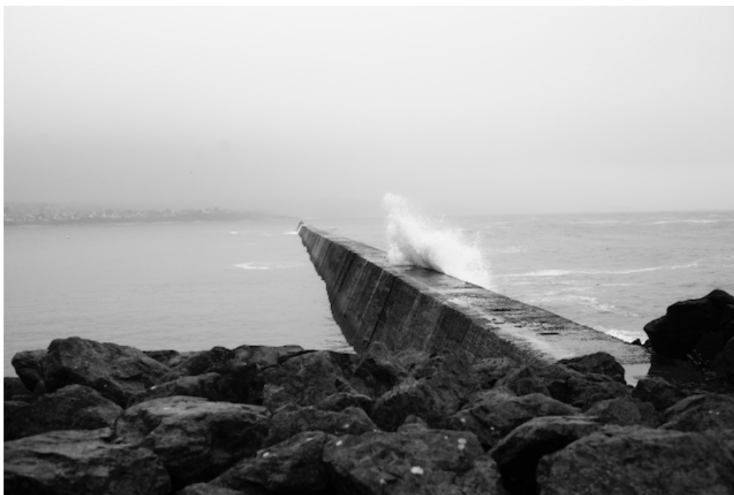
départ du port d'Audierne