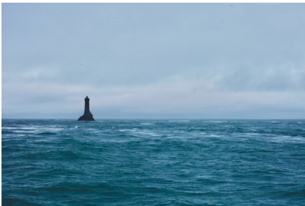
passage près du phare de la vieille

Ce retour en création sur l'Île de Sein tombait sous le sens. Toute l'équipe de la saison itinérante INIZI nous a apporté un soutien incommensurable pour rendre les choses possibles. Support logistique, accueil, mise en relation avec les habitant·e·s et présenter notre spectacle aux sénan·e·s.